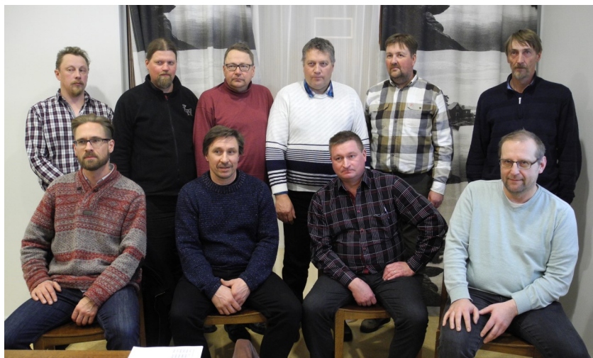
Perämeren rannikon kalatalousryhmä 2015-2018.

Oulun Seudun Leaderin hallinnoima Kalatalouden kehittämishanke on suunnattu kalatalousalan toimijoille ja vie eteenpäin Perämeren rannikon kalatalousstrategian tavoitteita. Kalatalousstrategiasta voidaan rahoittaa kalatalousalan yritysten ja yhteisöjen erilaisia kehittämistoimia. Strategias- ta ei rahoiteta vesistönnostustoimenpiteitä, vaan niihin voi saada rahoitusta mm. Oulun Seudun Leaderistä. Mikäli sinulla on hankeidea, ole yhteydessä toimistoomme!